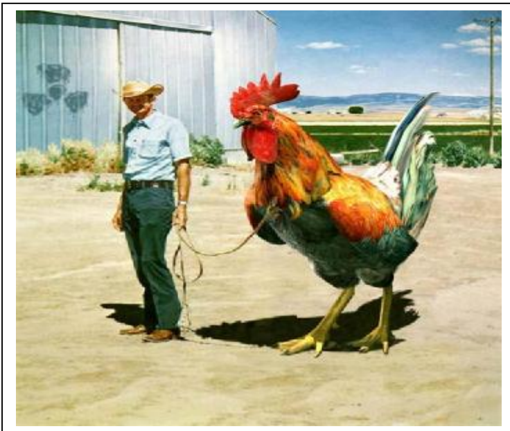
Gallina de los "huevos de oro" custodiada en un lugar desconocido hasta que se aprueben los presupuestos de 2006.

Con el comienzo de 2006, se retoman las negociaciones con el Sr. Alcalde en la búsqueda de un acuerdo que garantice el pago de las cantidades que se adeudan a los emplead@s municipales, ya que de no conseguirse acuerdos, se aproximan tiempos de movilización.