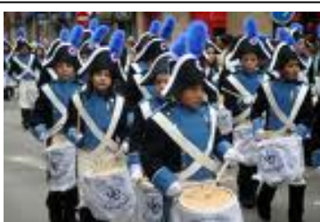
Tamborrada del día 2 según algunos