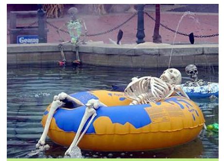
El Zapatazo y su aplicación en Majadahondum cambia los planes de vacaciones de algunos