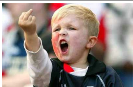
Continúan las muestras solidarias contra el dedazo