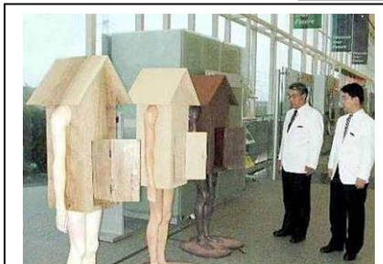
En estudio por RR. el trabajo desde casa durante las bajas laborales.